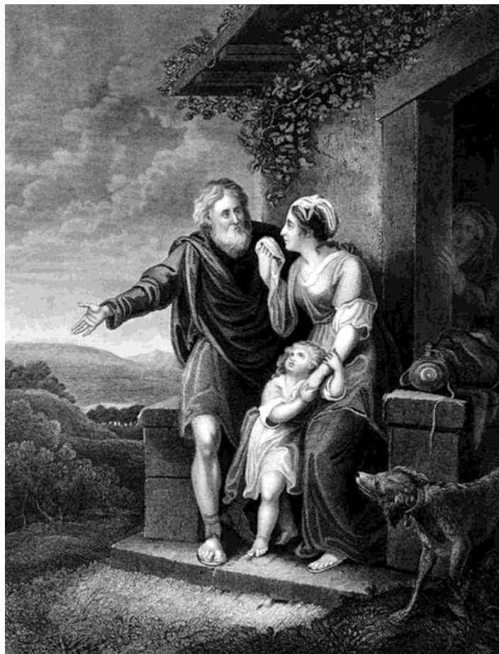
Le départ d'Agar , par William Hamilton, 1791.

Fondée en 1628 et incorporée dans l'Église épiscopale en 1804