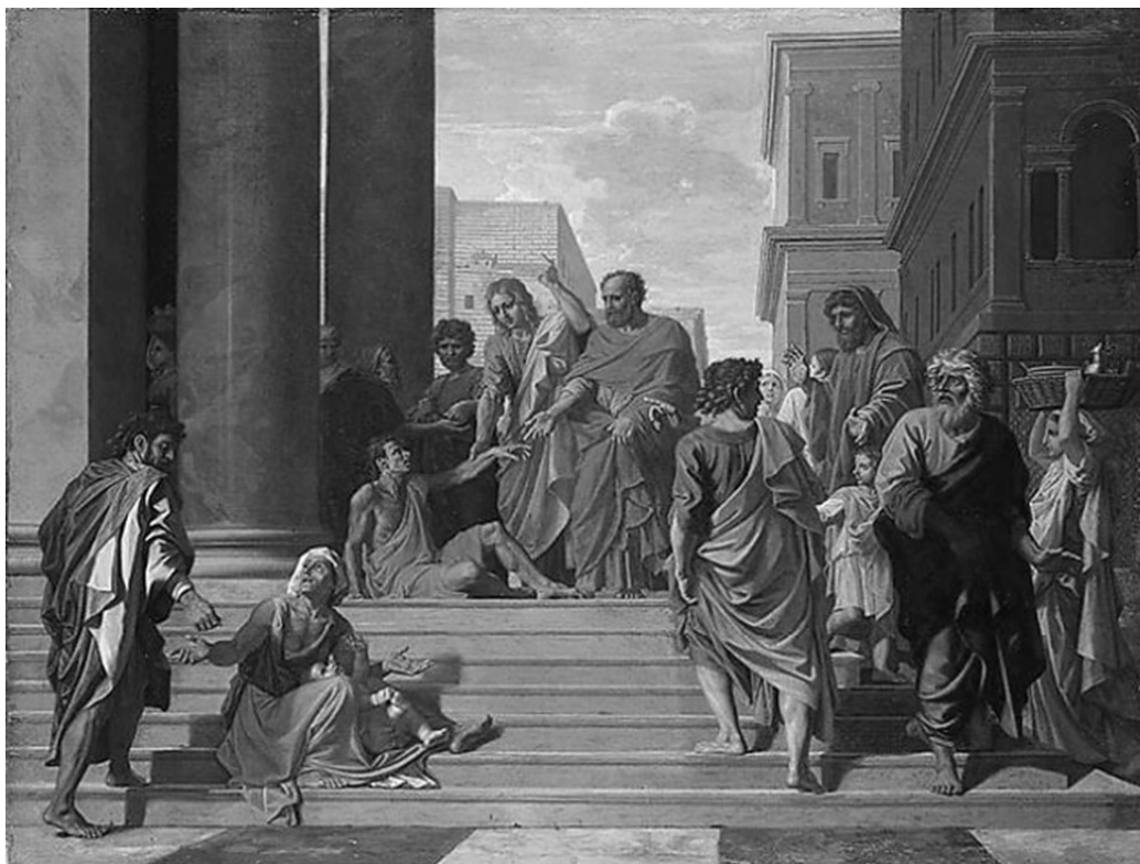
La Guérison de l'infirmes (ou du boiteux), par Raphael, début du XVIe siècle.

Fondée en 1628 et incorporée dans l'Église épiscopale en 1804