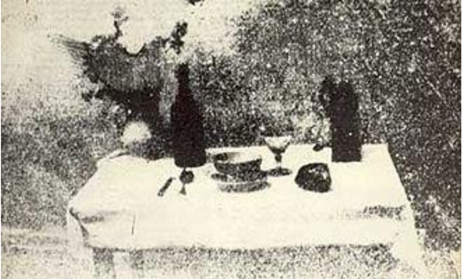
Nicéphore Niépce, La table servie , photographie vers 1823-1825