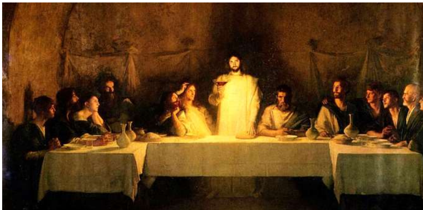
La Cène, par Pascal Dagnan-Bouveret, 1896.

Fondée en 1628 et incorporée dans l'Église épiscopale en 1804