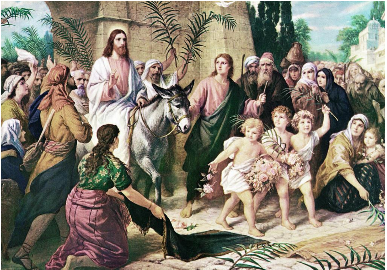
Entrée du Christ à Jérusalem, XIXe siècle Friedrich Wilhelm von Schadow

Fondée en 1628 et incorporée dans l'Église épiscopale en 1804