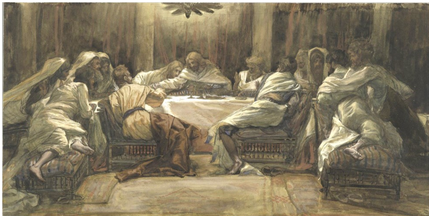
La Cène Judas met la main dans le plat , peinture de James Tissot (Nantes, France, 1836–1902)

Fondée en 1628 et incorporée dans l'Église épiscopale en 1804