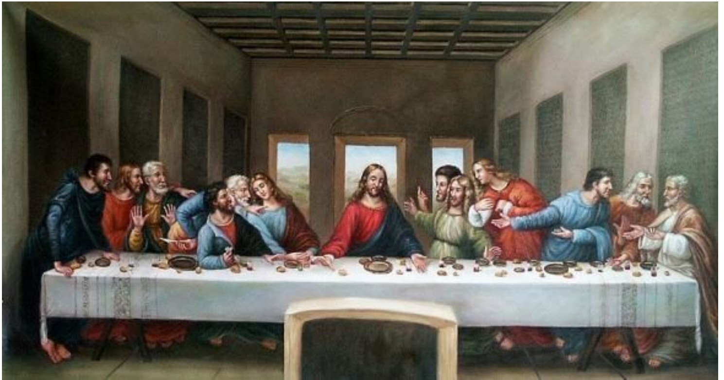
La Cène , Léonard de Vinci, vers 1495–1498.