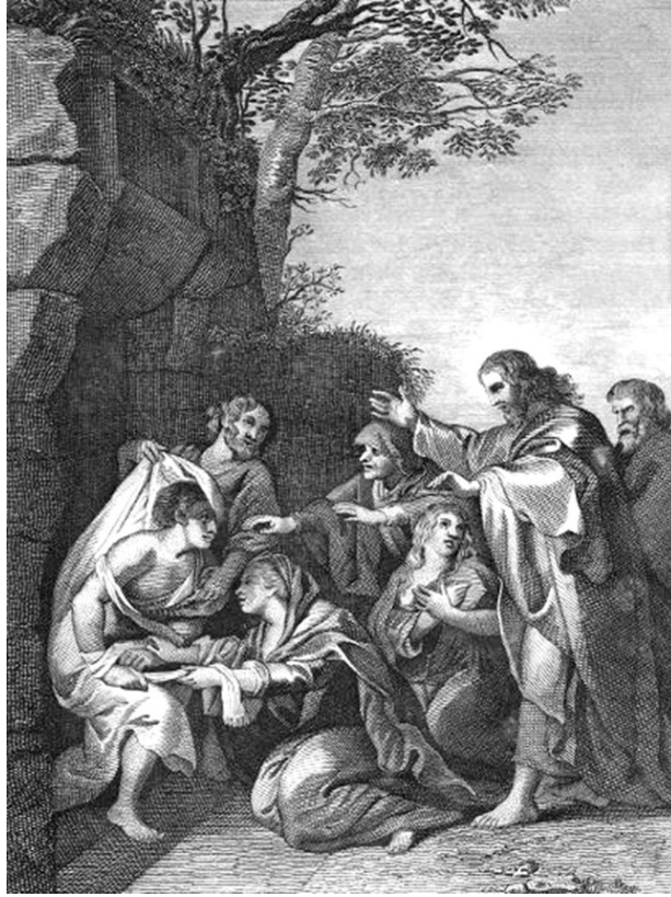
Le Christ ressuscitant Lazare, peinture de Pierre Paul Rubens, vers 1620.

Fondée en 1628 et incorporée dans l'Église épiscopale en 1804