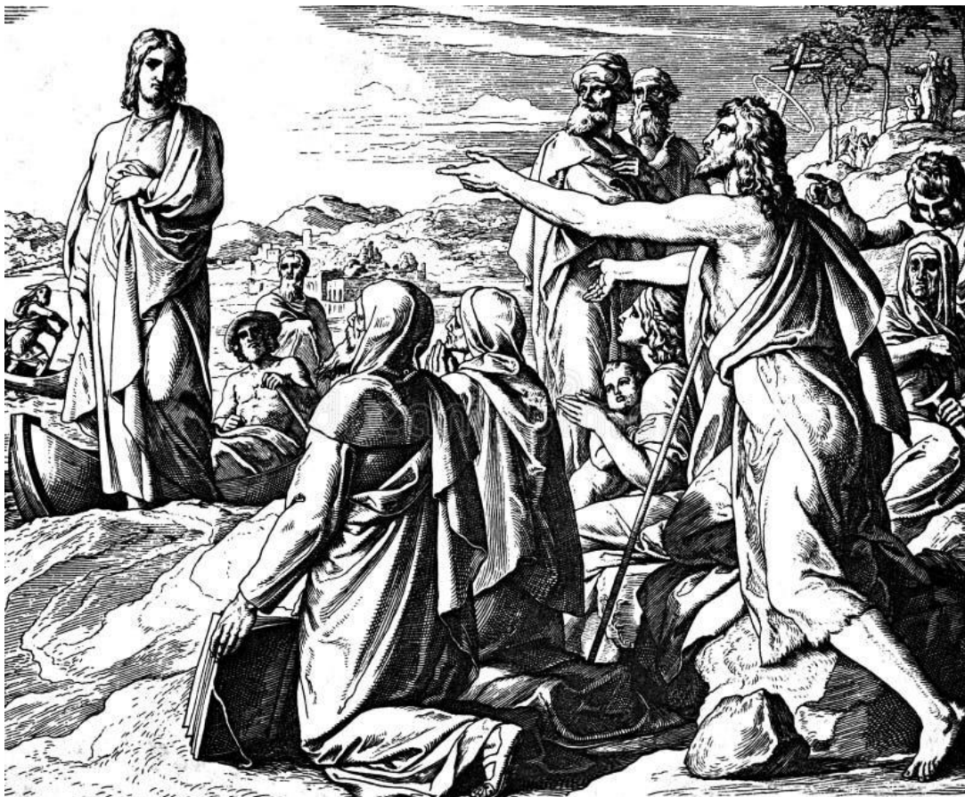
L'apôtre Jean désigne le Seigneur en proclamant : « Voici l'Agneau de Dieu ». Ancienne gravure tirée de Historia Sagrada (1920)

Fondée en 1628 et incorporée dans l'Église épiscopale en 1804