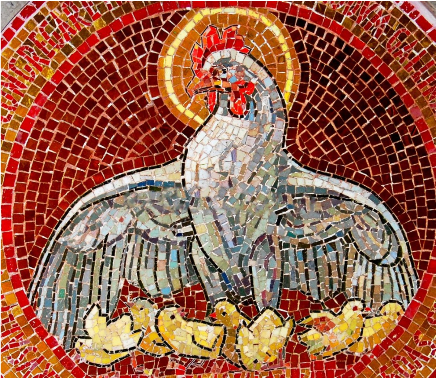
Altar Mosaic of Hen and Chickens, Church of Dominus Flevit, Mount of Olives, Jerusalem.

FONDÉE EN 1628 ET INCORPORÉE DANS L'ÉGLISE ÉPISCOPALE EN 1804