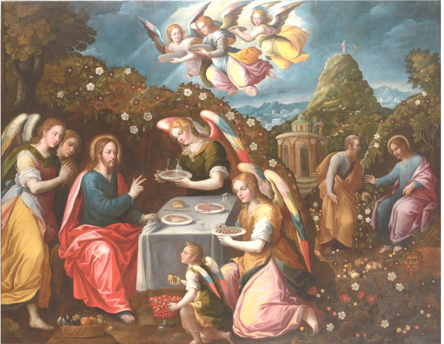
Jésus tenté par le démon et servi par les anges, École italienne du 17e siècle

FONDÉE EN 1628 ET INCORPORÉE DANS L'ÉGLISE ÉPISCOPALE EN 1804