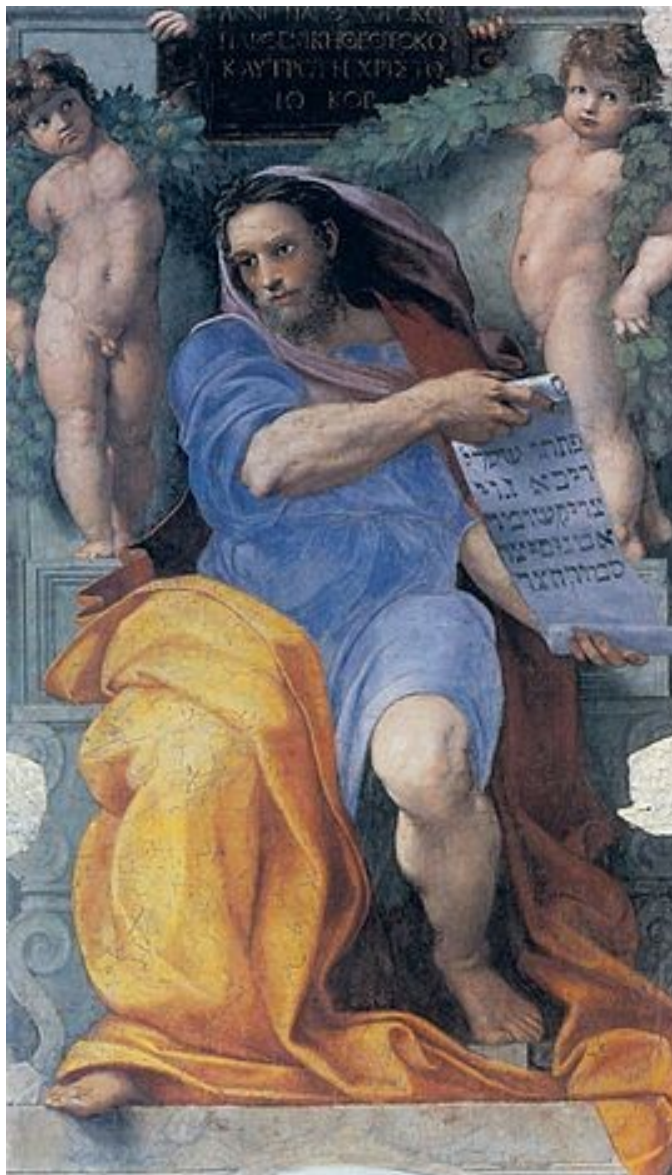
“Le Prophète Isaïe” Raphaël, 1512, Basilique Saint-Augustin de Rome (Italie)

Fondée en 1628 et incorporée dans l'Église épiscopale en 1804