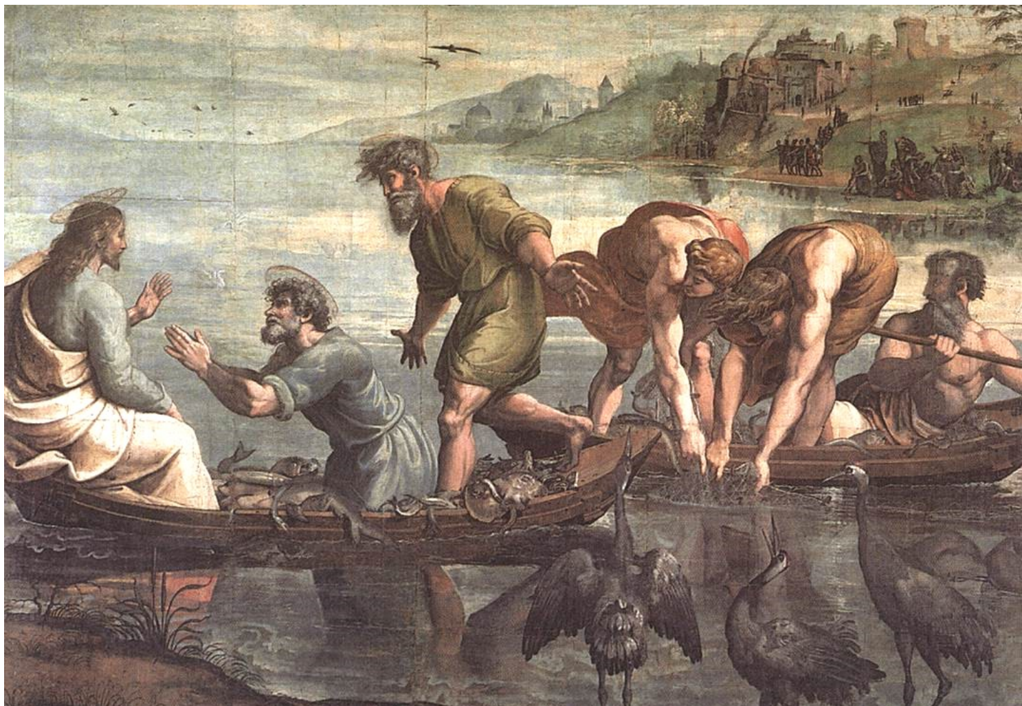
The Miraculous Draught of Fishes - Raphael (1515)

Fondée en 1628 et incorporée dans l'Église épiscopale en 1804