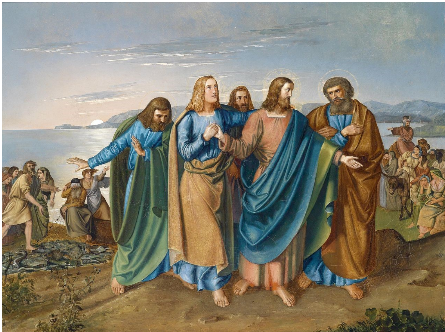
Jesus und seine Jünger am See Genezareth, monogrammiert, datiert 1833, Öl auf Leinwand

Fondée en 1628 et incorporée dans l'Église épiscopale en 1804