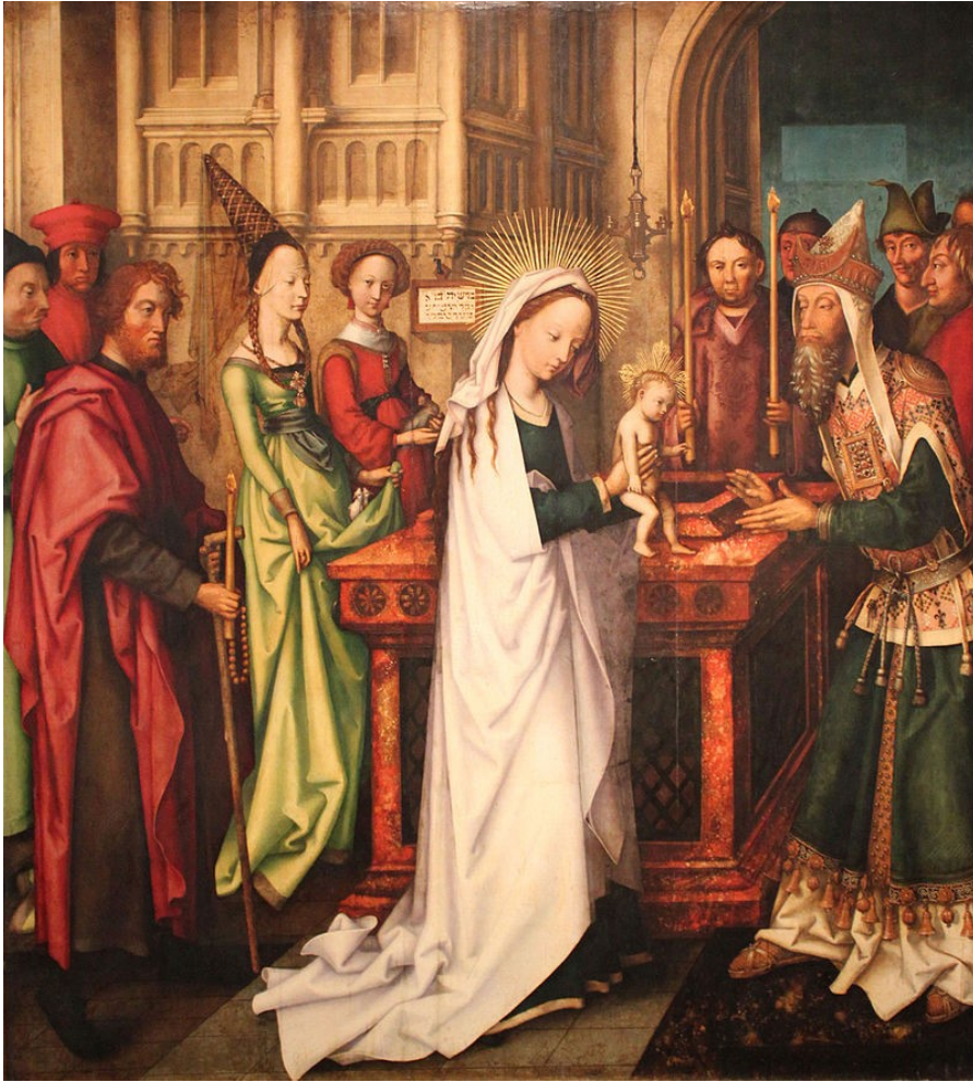
Présentation de Jésus au Temple (Hans Holbein l'Ancien, 1501, Kunsthalle de Hambourg).

Fondée en 1628 et incorporée dans L'Eglise épiscopale en 1804