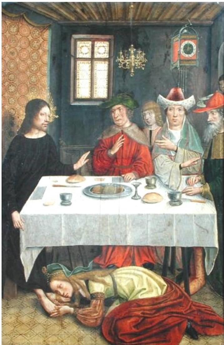
Le Repas chez Simon le pharisien, anonyme (XVE siècle)

Fondée en 1628 et incorporée dans L'Eglise épiscopale en 1804