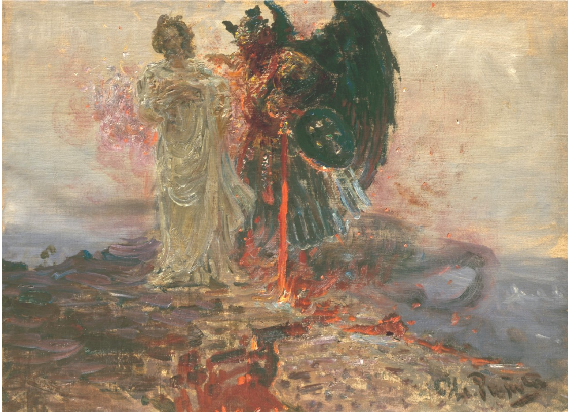
Get Thee Behind Me, Satan by Ilya Repin; 1895, oil on canvas, 46 × 62 cm, Russian Museum

Fondée en 1628 et incorporée dans L'Eglise épiscopale en 1804