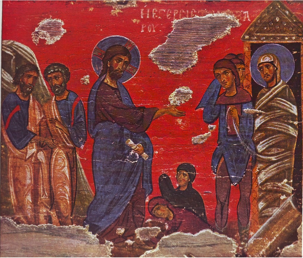
LA RÉSURRECTION DE LAZARE, ICÔNE GRECQUE, XIII E SIÈCLE

Fondée en 1628, et incorporée dans l'église épiscopale en 1804