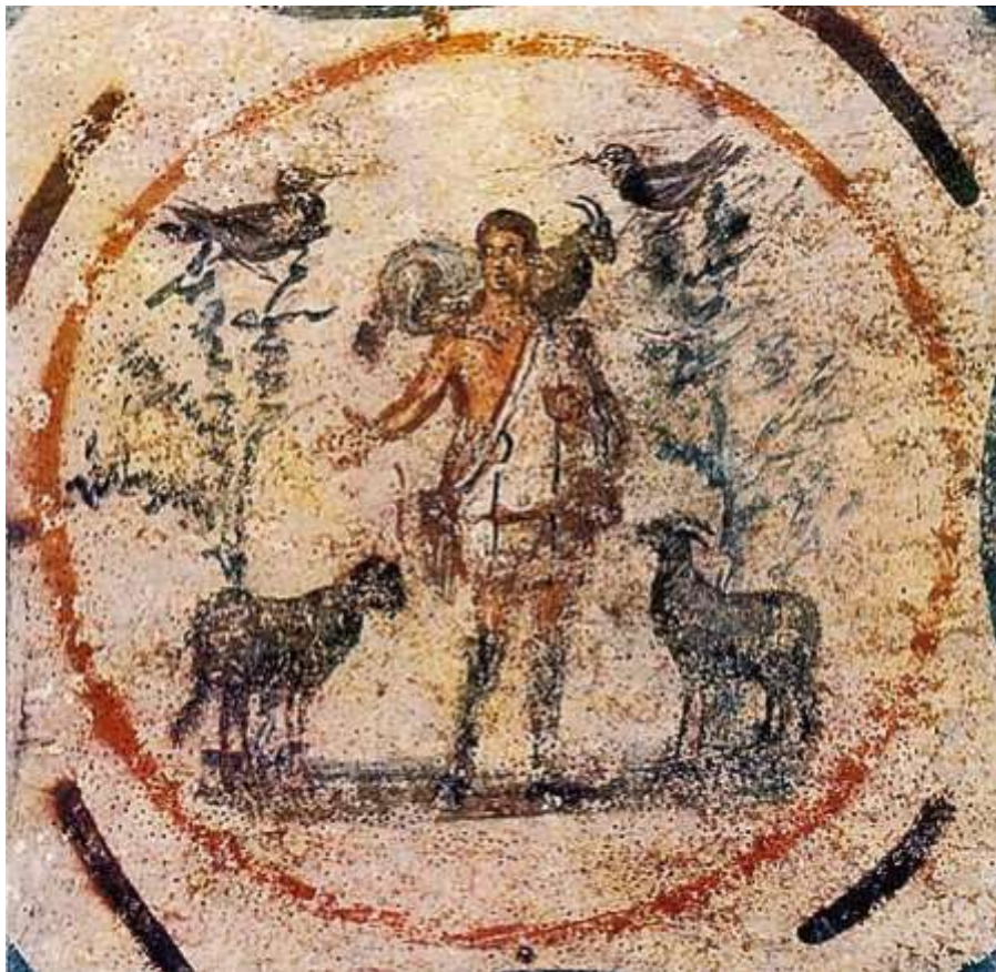
Good Shepherd from the Catacomb of Priscilla, 250–300

Fondée en 1628 et incorporée dans L'Eglise épiscopale en 1804