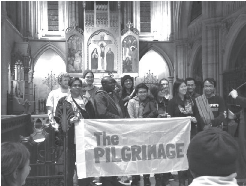
Service à la cathédrale américaine de Paris au moment de la grande Conférence des Nations Unies sur le Changement Climatique. (article par Lynnaia Main p.4)