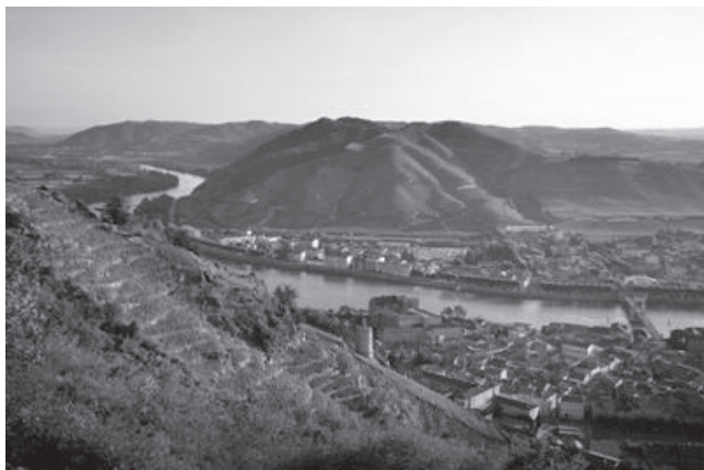
Le 5 février, Patrick Séré nous a offert une présentation lors de la dégustation de vins du Rhône. Photo du vignoble : les terrasses de Hermitage. (article par Philip Orawski et Patrick Séré p.5)